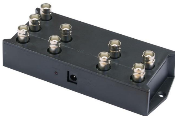
Рис.1 Разветвитель D-H108, внешний вид