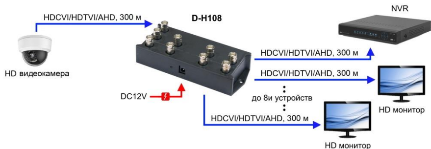
Рис.3 Схема подключения разветвителя D-H108